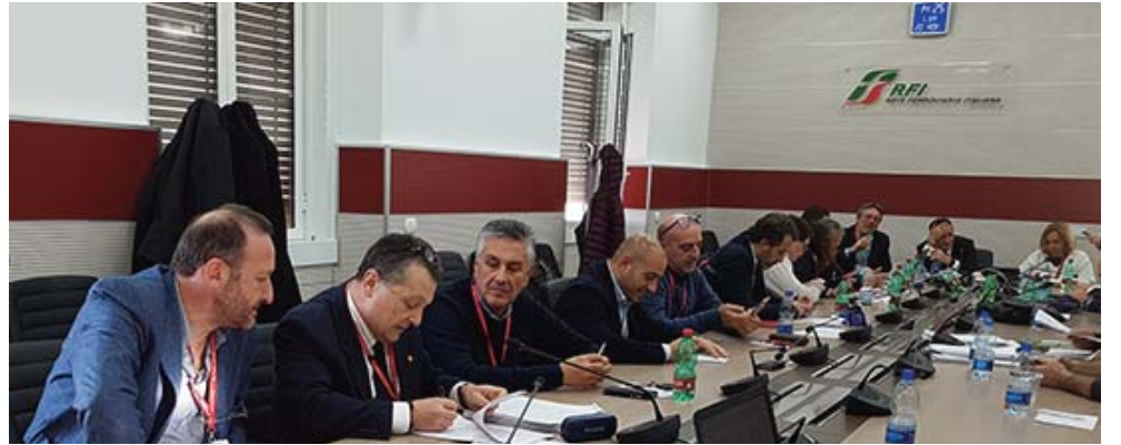
SI CONVIENE QUANTO SEGUE