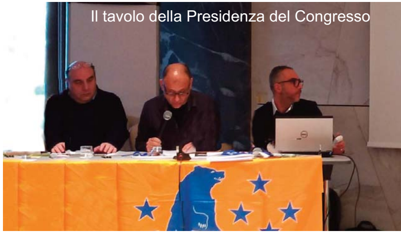
Il tavolo della Presidenza del Congresso